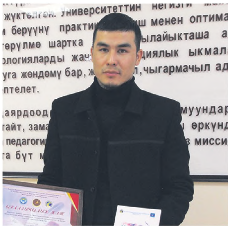
Аман болсун алтын энем а бирок, Тилеим дайым жараткандан жалына.

Мейли турмуш түртүп мени аңына, Миң кайталап канжар сайган жаным.